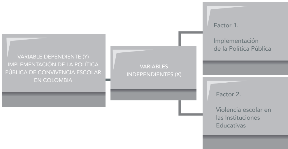
Ilustración 1. Esquema de variables

En este capítulo se presentará el análisis de los datos y los resultados, se iniciará presentando en el siguiente esquema las variables que fueron objeto de estudio.